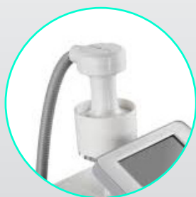
Revolucionário manípulo VUF

FOCUSHAPE PRO® é o primeiro sistema não invasivo de remodelação corporal que utiliza pulsos específicos de ultrassons em combinação com a terapia de sucção para eliminar as células adiposas de forma seletiva e totalmente indolor. Até ao momento, não possui comparação com nenhum tratamento do mercado e representa a nova geração nos tratamentos de corpo.